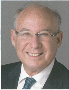
ジェイコブ・フレンケル Jacob A. Frenkel

シカゴ大学より経済学博士号取得。IMF経済顧問兼調査局長、シカゴ大学経済学部教授、イスラエル中銀総裁などの要職を歴任。現在JPモルガンチェースインターナショナル会長及びG30理事会議長。また、ピーターソン研究所等の理事を務める。イスラエル経済学賞ほか受賞多数。