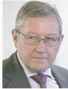
クラウス・レグリング Klaus Regling

Dr. Frenkel is Chairman of JPMorgan Chase International and also of the Board of Trustees of the G-30. Previously he was Governor of the Bank of Israel, Economic Counselor and Director of Research of the IMF, and Professor of Economics, University of Chicago. He is a member of many boards such as Peterson Institute for International Economics and Trilateral Commission. He is a Laureate of the 2002 Israel Prize in Economics with many other awards. He holds Ph.D in economics from the University of Chicago.