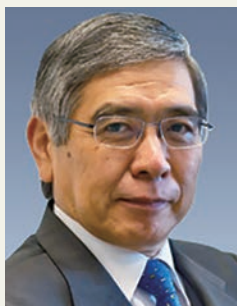
黒田 東彦 Haruhiko Kuroda