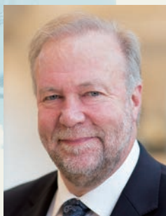
ハン・デ=ヨン Han de Jong

1981年アムステルダム自由大学を卒業後、ABN AMRO内外で各種の職務を経験。2000年から同アセット・マネジメントで投資戦略チームを統括。2005年から同銀行のチーフエコノミスト。また、アムステルダム自由大学ではマクロ経済学の教鞭をとる。